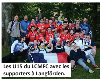
Les U15 du LCMFC avec les supporters à Langförden.