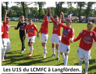
Les U15 du LCMFC à Langförden.

Le bilan de ces 4 jours est le même pour tous les participants : d'excellents souvenirs et une folle envie d'y retourner !