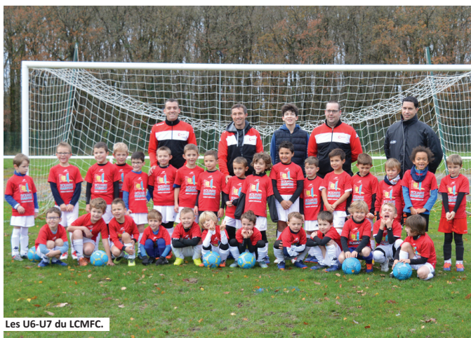
Les U6-U7 du LCMFC.