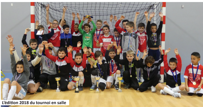
L'édition 2018 du tournoi en salle