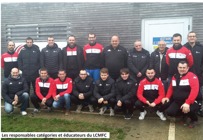
Les responsables catégories et éducateurs du LCMFC

La présidence du club de football a remis samedi 8 décembre au stade des Noues un équipement vestimentaire aux différents responsables de catégories et éducateurs. Cette dotation marque la volonté du club à reconnaître leur investissement au sein du club tout au long de l'année sportive. Cette action s'inscrit pleinement dans le projet sportif et éducatif du club «LE CELLIER MAUVES FC».